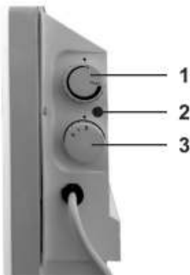
Рис. 2 Панель управления